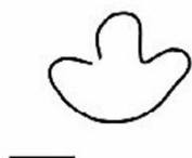
Lophiopus latus Ellenberger 1980