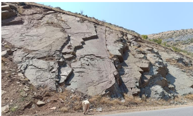
شکل ۳: رخنمونی از رسوبات حاوی ردپا در منطقه سولی چای کوه های طارم