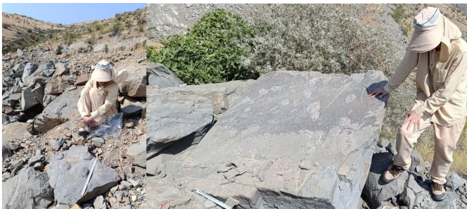
شکل ۲: نمایی از تخته سنگ های بزرگ و کوچک یافت شده حاوی ردپاهای سه انگشتی پستانداران در منطقه سولی چای، کوه های طارم زنجان

در ردپاهای تخته سنگ بزرگتر (ردهای شماره ۱- ۱۰ جدول ۱)، انگشت میانی بزرگتر از انگشتان جانبی است. انگشتان جانبی نسبت به انگشت میانی متقارن اند (شکل ۴). یکی از انگشتان کناری می تواند اندکی کوچکتر از دیگری می باشد. اثر کف پا بزرگتر از انگشتان و در بعضی ردپاها به خوبی مشاهده می شود. موجود به صورت کف رو تا نیمه کف رو بوده است.