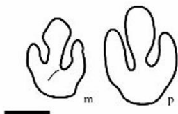
Moropopus elongatus Abbassi et al. 2016